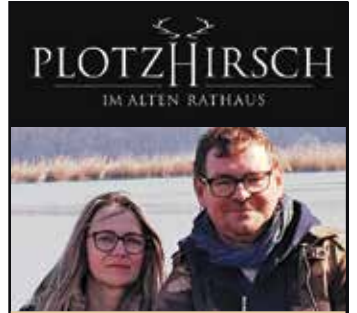
von Stefan Pavek