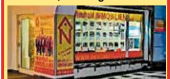
8200 Gleisdorf, Bürgergasse 12 Individuelle Öffnungszeiten nach Terminvereinbarung per Telefon