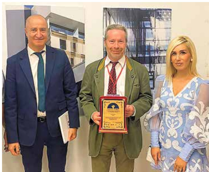
... mit dem türkischen Konsul...