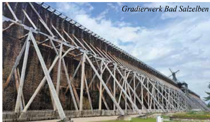
Gradierwerk Bad Salzelmen

Der RB Eggersdorf freut sich bereits heute auf den Gegenbesuch seiner deutschen Freunde in zwei Jahren im heimischen Eggersdorf!