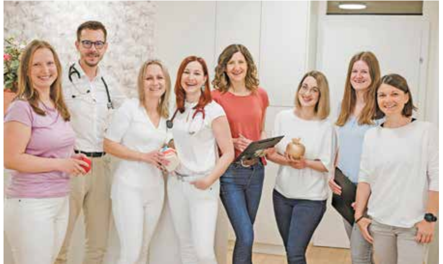
Das Team der Praxisgemeinschaft bietet ein breites Behandlungsangebot für die Patientinnen und Patienten.

aus Nöstl bei Weiz in bewährter Weise verantwortlich, die in enger Zusammenarbeit mit der Fa. Unidach (Dachdecker-Arbeiten) kooperierte. Für den Trockenbau konnte mit der Fa. Pichler Trockenbau GmbH. aus Passail ebenso ein regionaler Profi-Betrieb gewonnen werden, die Heizungs- und Sanitärinstallationen der Ordination Dr. Perl sowie der Zahnarztpraxis samt Behandlungsräumen und von allen neun Wohnungen wurde von der Fa. KAP-Haustechnik aus Graz-Puntigam erledigt. Die Fa. Lieb Bau Weiz war mit ihrem Team für das Gelingen der Baumeisterarbeiten im Hochbau ein Garant. Im Inneren des Gebäudes zeichnete das Team von fliesen & wärmedesign Kletzenbauer aus St. Ruprecht an der Raab für die Böden- und Fliesenarbeiten verantwortlich. Die Tischlerei (und Wohnstudio) Ing. Elisabeth Scharler, ebenfalls aus St. Ruprecht, gestaltete die Tischlerarbeiten.