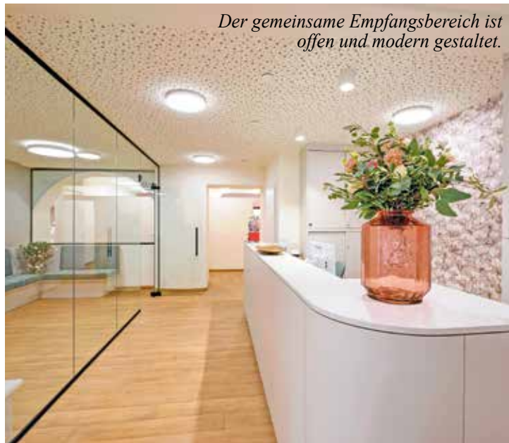
Der gemeinsame Empfangsbereich ist offen und modern gestaltet.