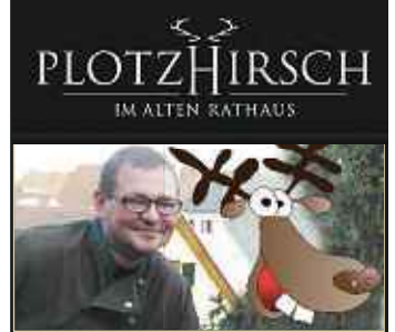
von Stefan Pavlek