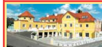
8160 Weiz, Marburgerstr. 104