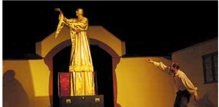
Meterhoch erhebt sich der Mammon über Jedermann, als es ans Abschiednehmen geht... (Jedermann-Premiere Rettenegg 1.8.2008)

Die Theatergruppe Rettenegg spielt heuer nach zwei coronabedingt spielfreien Jahren wieder Sommertheater und zwar den „Jedermann“ als Freilufttheater neben der Pfarrkirche Rettenegg (bei Schlechtwetter in der Kirche). Da Druck und Postaufgabe diese Ausgabe bereits vor der Premiere stattfinden mussten, finden Sie den Premierenbericht erst in der September-Ausgabe, haben aber bis 14. August noch siebenmal Gelegenheit, das Spiel vom Sterben des reichen Mannes von Hugo von Hofmannsthal in der Dialekt-