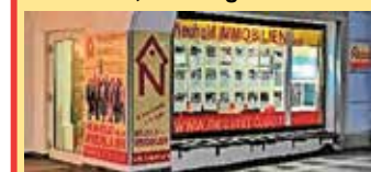
8200 Gleisdorf, Bürgergasse 12 Individuelle Öffnungszeiten nach Terminvereinbarung per Telefon