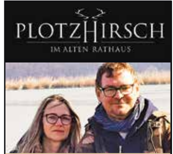
von Stefan Pavek

BAUMSCHULE + GARTENGESTALTUNG 8182 Apfeldorf Puch 20 • T. 03177 2252 office@hoefler.at • www.hoefler.at