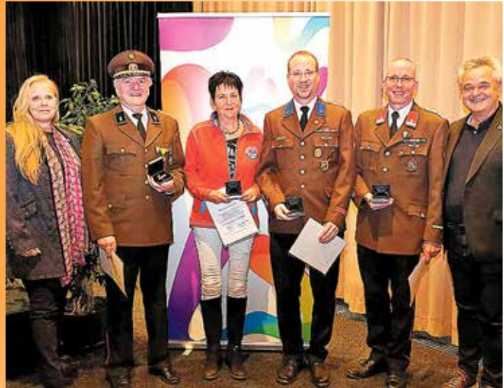
Stellvertretend für alle Ausgezeichneten stehen die Ausgezeichneten der Stadtfeuerwehr Weiz sowie der Kameradschaftskapelle Weiz.

Musikalisch umrahmt wurde die Festveranstaltung von den hochtalentierten Musiker:innen des Klarinettenensembles der Musikschule Weiz.